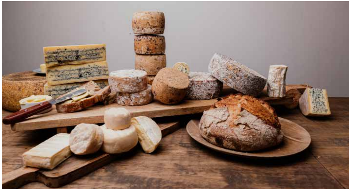
Guter Käse muss nicht weit reisen. In Schleswig-Holstein gibt es nicht nur eine Vielzahl an Käsereien, sondern auch viele unterschiedliche Sorten Käse.